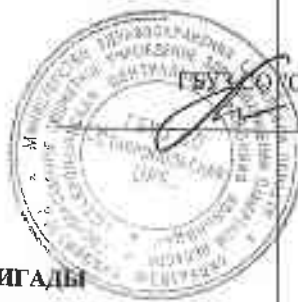
ГРАФИК ВЫЕЗДА МОБИЛЬНОЙ МЕДИЦИНСКОЙ БРИГАДЫ ДЛЯ ПРОВЕДЕНИЯ ДИСПАНСЕРИЗАЦИИ НАСЕЛЕНИЯ, ОКАЗАНИЯ МЕТОДИЧЕСКОЙ ПОМОЩИ ПО СООТВЕТСТВУЮЩЕЙ СПЕЦИАЛЬНОСТИ МЕДИЦИНСКИМ РАБОТНИКАМ ПЕРВИЧНОГО АМБУЛАТОРНОГО ЗВЕНА ВО II КВАРТАЛЕ 2017 ГОДА